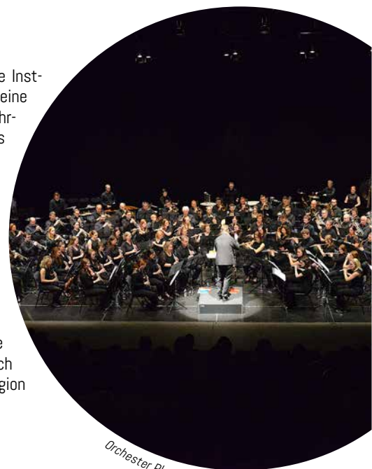
Orchester Play-In

ist er bestens bekannt: Viele Instrumentalisten schätzen seine Werke und er hat bereits mehrfach das Play-In geleitet, als Jurymitglied fungiert sowie Dirigierworkshops gegeben. Als exzellenter Pädagoge versteht er es, seine musikalische Leidenschaft auf eine besonnene Art weiterzugeben. Musikerinnen, Musiker und Publikum dürfen sich darauf freuen, dass dieser herausragende belgische Dirigent und Komponist nach vielen Jahren in unsere Region zurückkehrt.